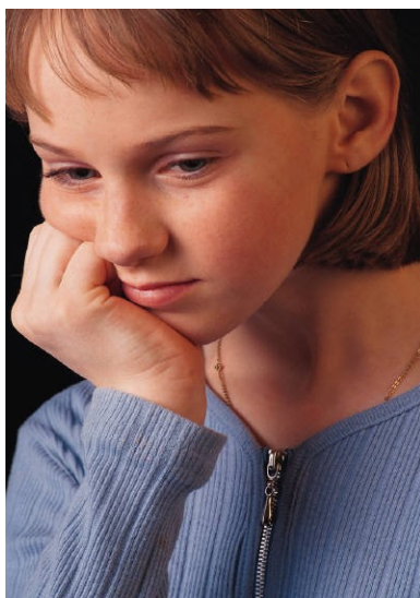
Los pacientes tienen el derecho de presentar una queja o reclamación.

A veces las quejas no se pueden resolver con la Red. Si la Red no puede resolverse su queja, usted será referido a una agencia que lo podrá ayudar.